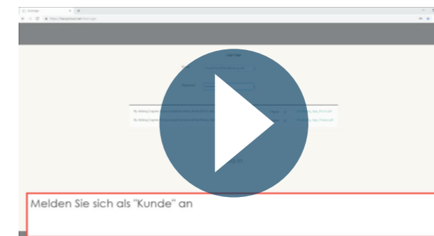
Beispiel eines der verfügbaren How-to-Videos